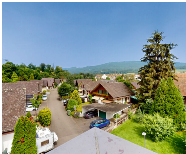
Ausblick Richtung Jura