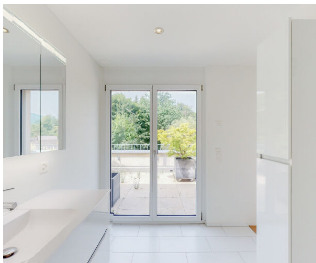
Bad en suite mit Dusche und zugang zur Terrasse